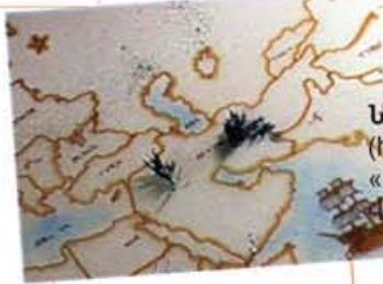
Նեգար Թահսիլի Ֆահադան, 2005 (Իրան) «Մի բնույթի...» Վիդեո, 3 ր. Negar Tahsili Fahadan, 2005 (Iran) "Of one essence..." Video, 3 min