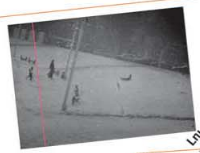
Լուսինե Թալալյան, 2008 Վերագտնելու կորուսվածը Lusine Talalyan, 2008 Refinding the lost Action