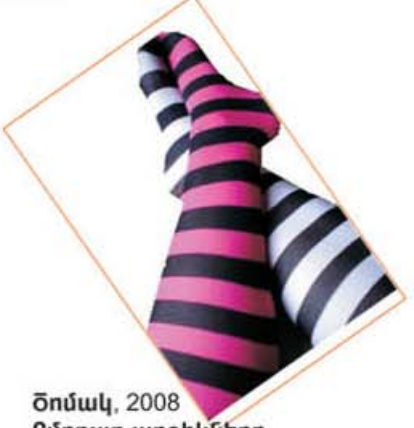
Ծոմակ, 2008 Ըմբոստ աղջիկները ըմբոստ գործեր են անում Պիտակներ Tsomak, 2008 The rebellious girls do rebellious works Stickers