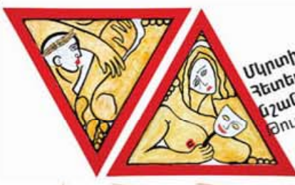
Մկրտիչ Տոնոյան, 2007 Բետեր-ուտոպիա: որոշ կատարյալ նշաններ Յուղ/տպագրություն Mkrtich Tonoyan, 2007 Hetero-utopia. Some Perfect Signs P-print